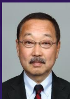
大住 良之 (18期) サッカージャーナリスト

サッカージャーナリストである大住良之氏(18期)のワールドカップロシア大会観戦記を皮切りに、ロシアビジネスのコンサルタントである菅原信夫氏(18期)にはロシア社会観やロシア社会の特徴を、福林徹氏(13期)からはスポーツ医学面からの進歩やロシアなど諸外国との比較など、さらには、鎌倉市にお住いのスポーツ評論家玉木正之氏を特別にお迎えして巨大スポーツイベントと社会のつながり、そして2020年東京オリンピックまでになすべきことなど、サッカー、ロシア、スポーツ、世界を縦横メッシュでお話いただきます。