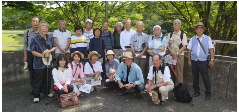
歴史文学散歩（9月26日）集合写真

駅前から2台連結の大型バスで慶応大学前バス停に、正門の外にある、新築の湘南慶応病院、慶応看護学校を見、学校内に。本校は藤沢市の北西部に慶応義塾大学湘南藤沢キャンパス(SFC)として1990年に設立された。日本の大学の中で先陣を切って大学改革に着手し、その多種多様なアイデアは多くに大学の手本となった。日本におけるインターネット(Japan University NETwork: JUNET)の起源としても知られている。