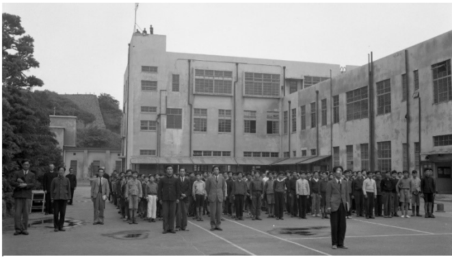
田浦校舎時代の朝礼の様子

て、さらにその校舎の棟の一つを今もなお改修して自衛隊が使っているという、かなり使い続けられている建物である。おおもとが旧海軍施設なので、建物がとても頑丈であるようだ。その残っている校舎は中学校舎として使っていたらしいのだが、今回、その今日も使用している建物に入らせていただけた。古い写真とくらべてみると外見は改装工事によりかなり変わっているのだが、中に入るとその面影は残っていた。とある教室には黒板が残されていたり、扉が高かったり、教室がとても縦長だったり、大船の旧校舎での古びた雰囲気醸し出していた。思い返せば、なにかと大船旧校舎に似通っている気がするという感覚が非常に不思議で面白く感じられる。