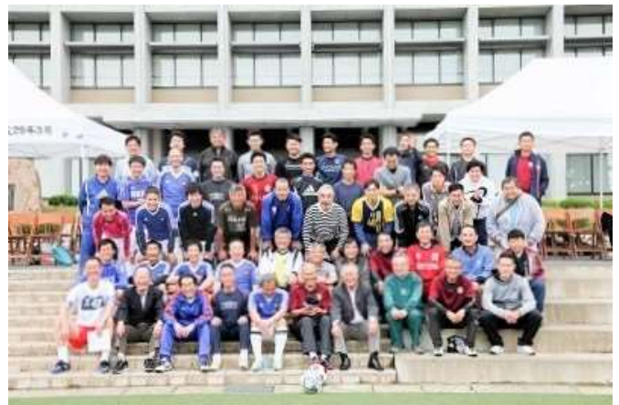
サッカー部OB会 JJHAF対抗戦 (10月14日、15日)