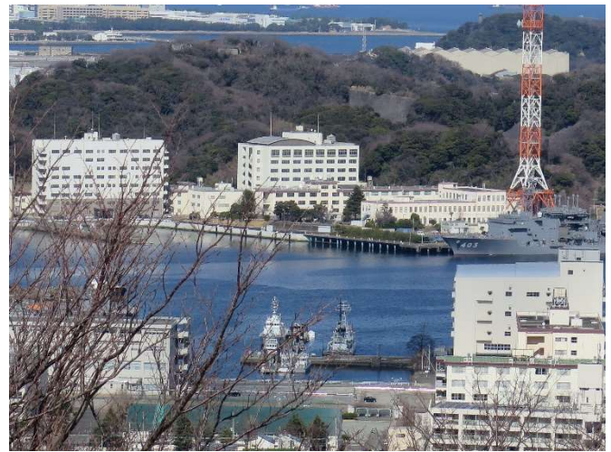
旧田浦校舎付近の遠景