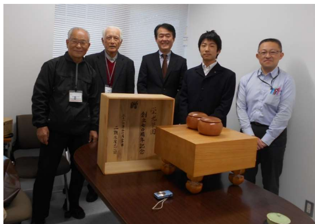
囲碁部キャプテン、顧問、望月校長と一緒に記念撮影