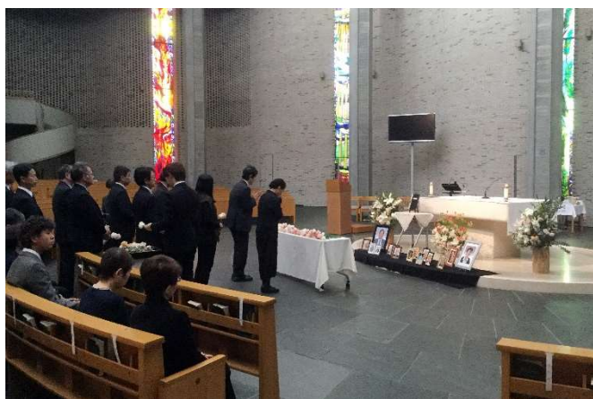
上智学院追悼ミサの様子 (11月11日)