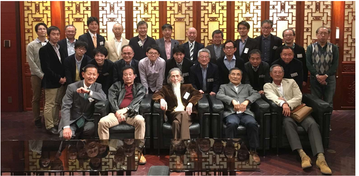
バドミントン部OB会 (11月11日)